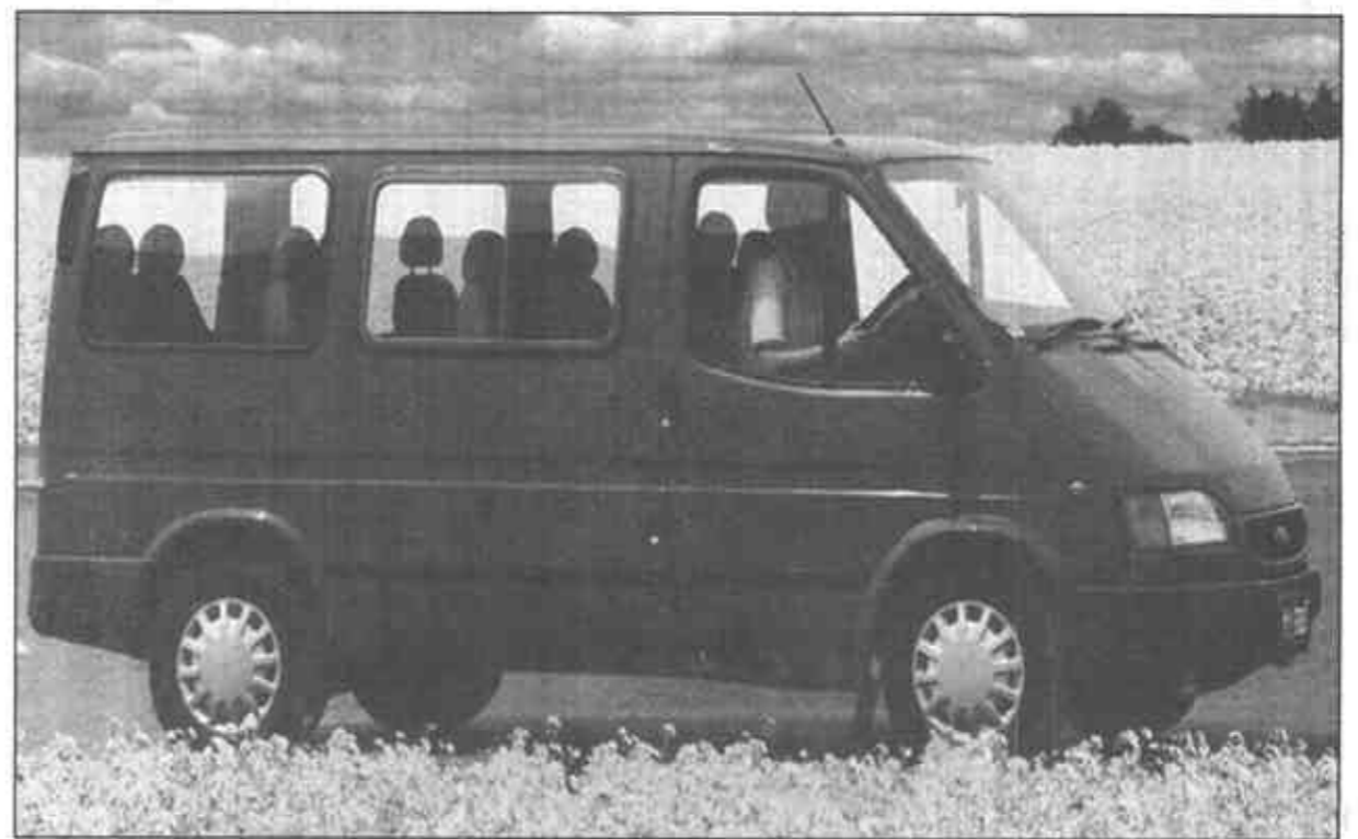
江铃应用五十铃技术的硕果JMC系列产品